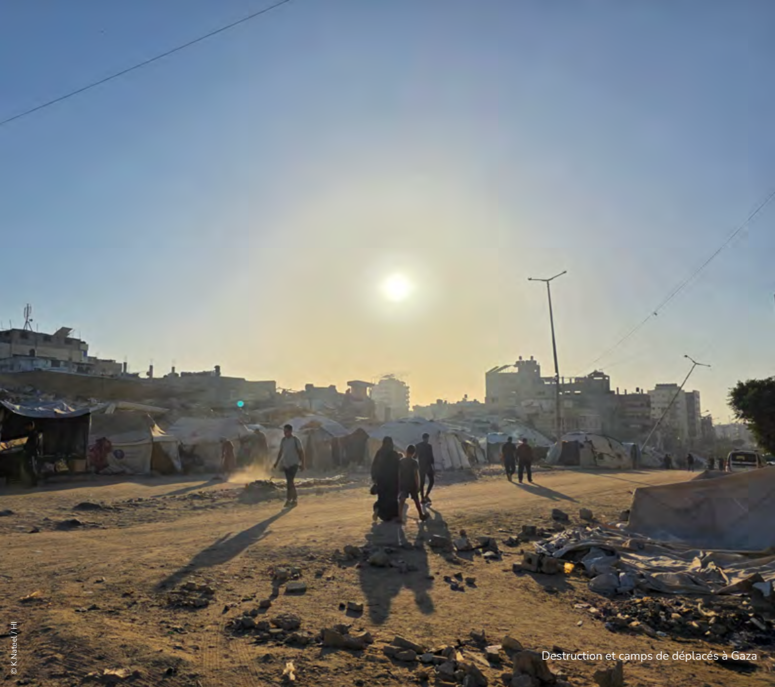
Destruction et camps de déplacés à Gaza

Jamais dans notre histoire nous n'avons connu autant de décès parmi nos collègues et les membres de leurs familles dans les conflits où nous intervenons : entre novembre 2023 et novembre 2024, nous avons eu à déplorer la mort de quatre collègues à Gaza, au Liban, en Syrie, ainsi que sept de leurs enfants. Nous leur rendons hommage et adressons toutes nos pensées à leurs familles et amis.