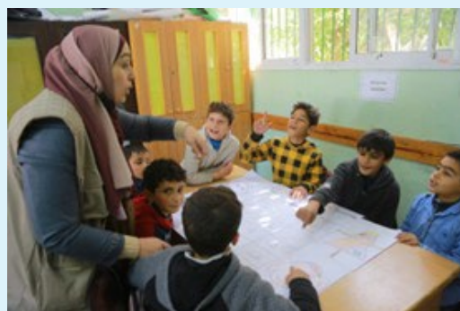
Enfants participant à une classe de rattrapage dans la bande de Gaza_ photo par l'Institut Tamer Institute pour l'Education Communautaire, 2023. ©HI

domaines a aidé les membres du corps enseignant à devenir plus résilients dans la poursuite de l'enseignement pendant les perturbations.