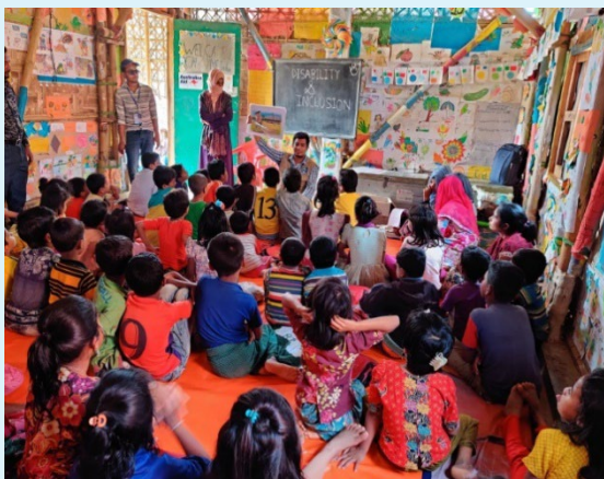
Enfants dans un centre d'apprentissage temporaire dans l'un des sites du camp de réfugiés de Cox's Bazar, apprenant à soutenir leurs camarades handicapés lors d'une session de sensibilisation.

Il y a maintenant plus d'un million de réfugiés dans le camp de Cox's Bazar, le plus grand camp de réfugiés au monde, qui s'étend sur plusieurs sites sur la côte sud-est du Bangladesh. L'afflux de réfugiés en provenance du Myanmar en 2017 a exercé une pression accrue sur l'ensemble des ressources. Les enfants, handicapés ou non, arrivent en quête d'un refuge, mais ont également besoin du sanctuaire et de la routine d'un environnement d'apprentissage normal.